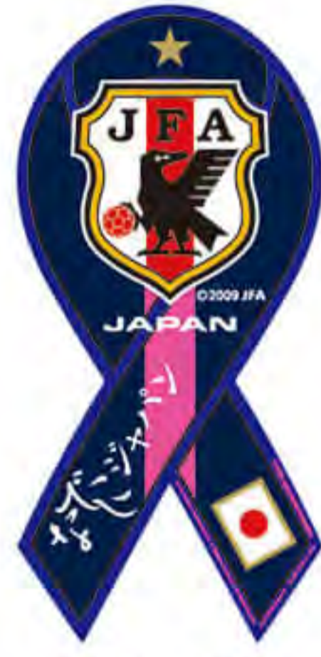
サッカー日本 女子代表様