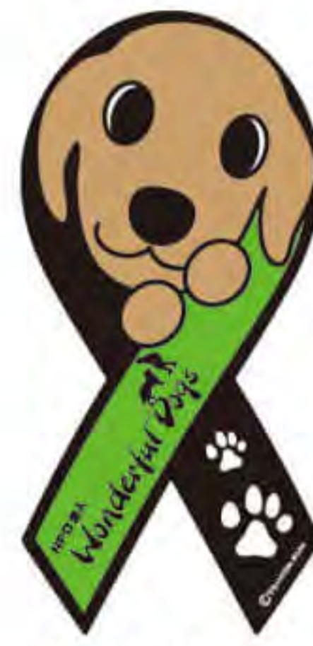
ワンダフルドッグ様