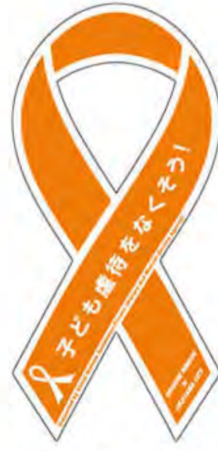
岡山市子ども福祉課様