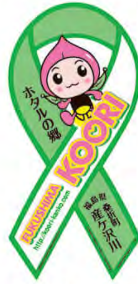
福島県桑折町観光協会様