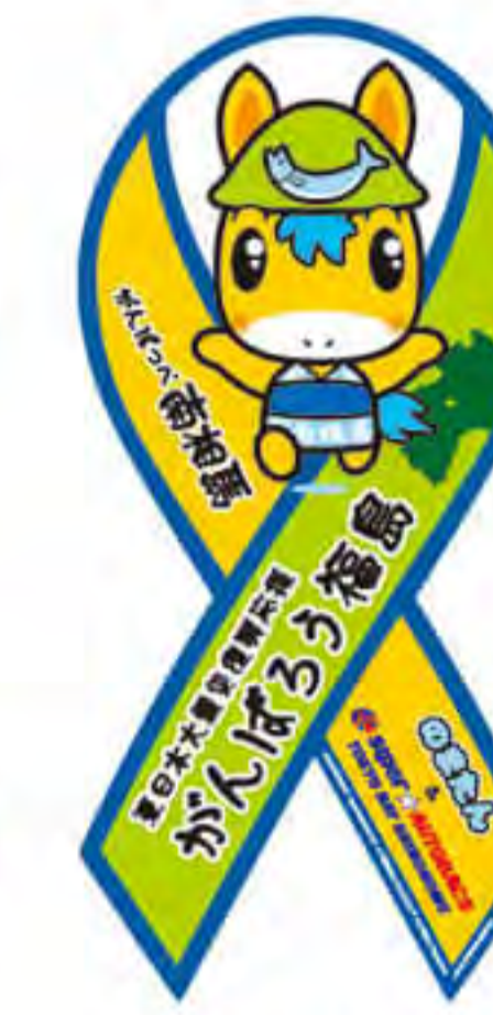
スーパー オートボックス様