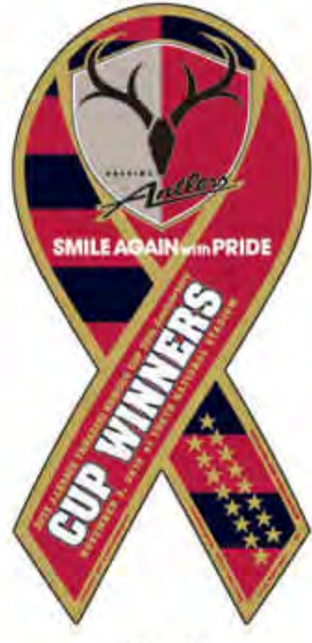
鹿島 アントラーズ様