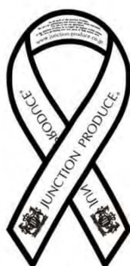
ジャンクション様