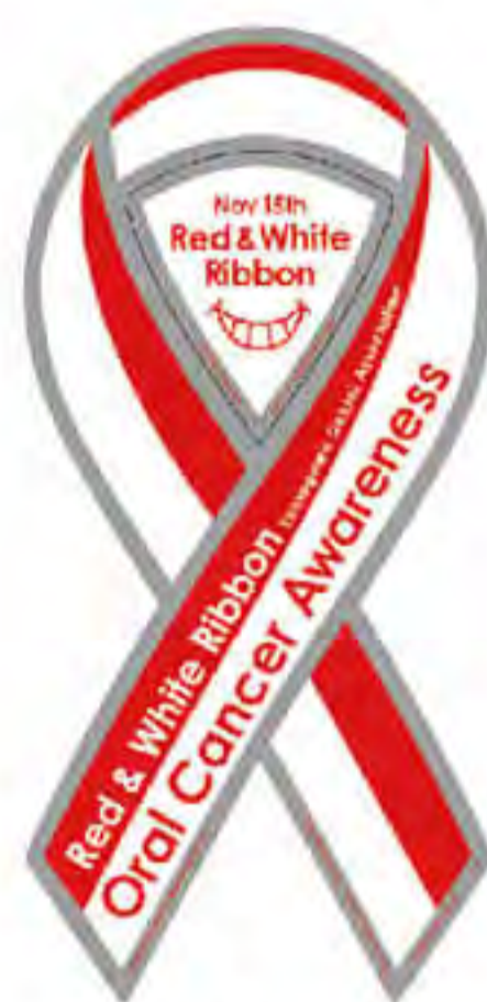
玉川歯科医師会様