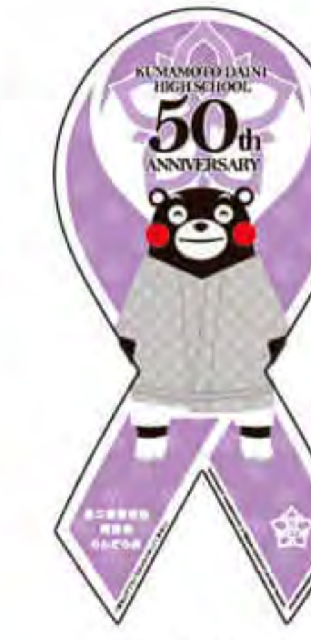
熊本県立 第二高校様