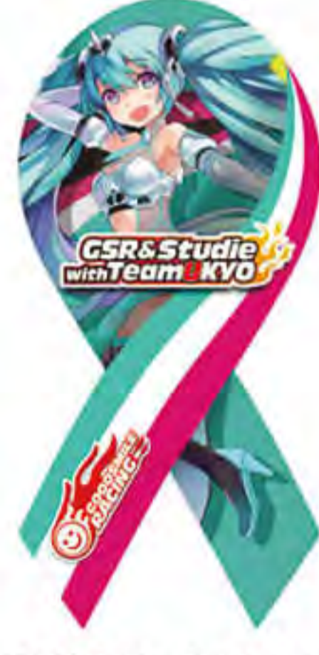
GOOD SMILE RACING 様