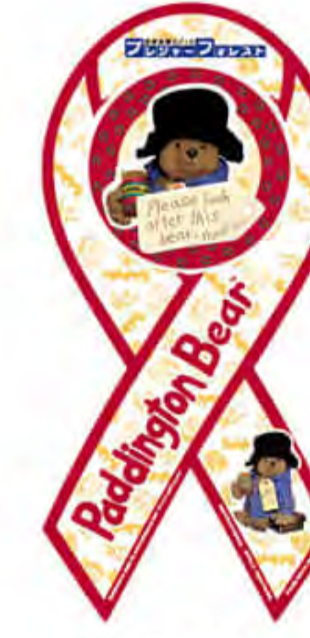
パディントン 相模湖様