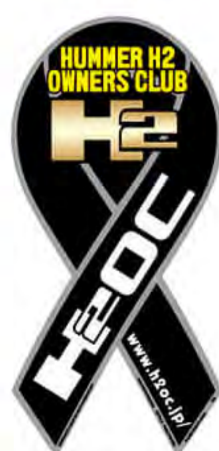
ハマー H2 オーナーズクラブ様