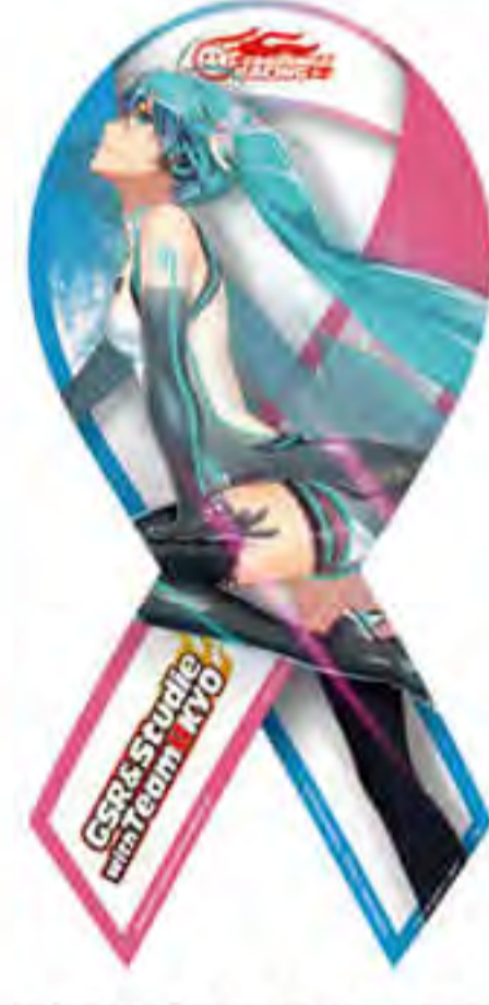
GOOD SMILE RACING 様