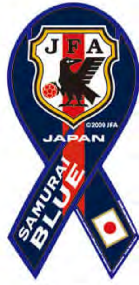
サッカー 日本代表様