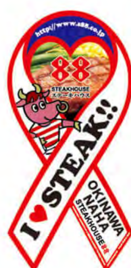
ステーキ ハウス 88 様