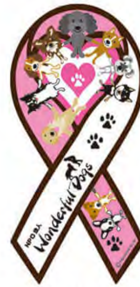
ワンダフルドッグ様