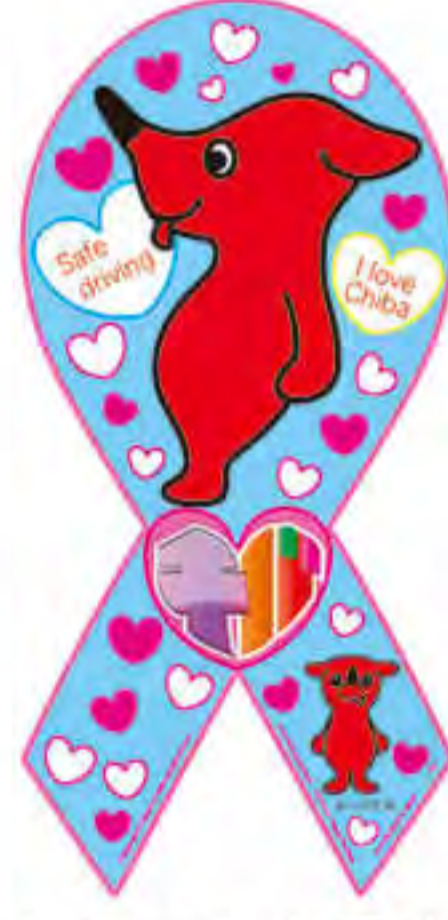
ネクスコ東日本 エリアサポート様