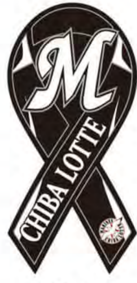
千葉ロッテ マリーンズ様