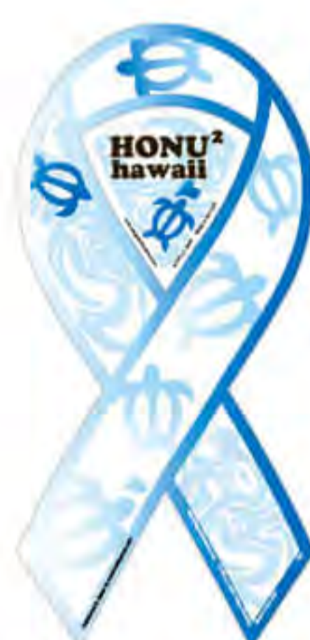
HONU HONU hawaii 様