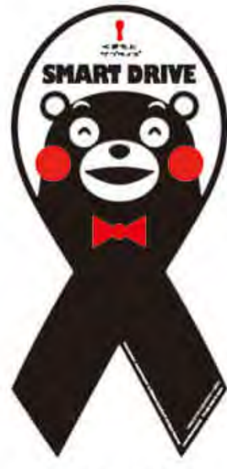
ブレイン トラスト様