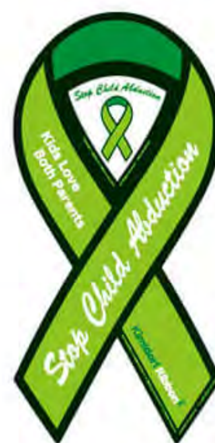
子供連れ去り問題キミドリリボン様