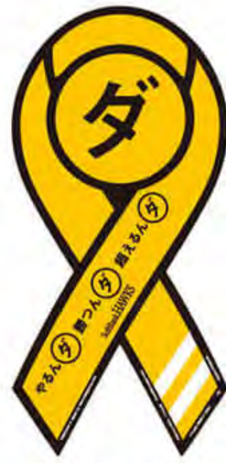
ソフトバンク ホークス様