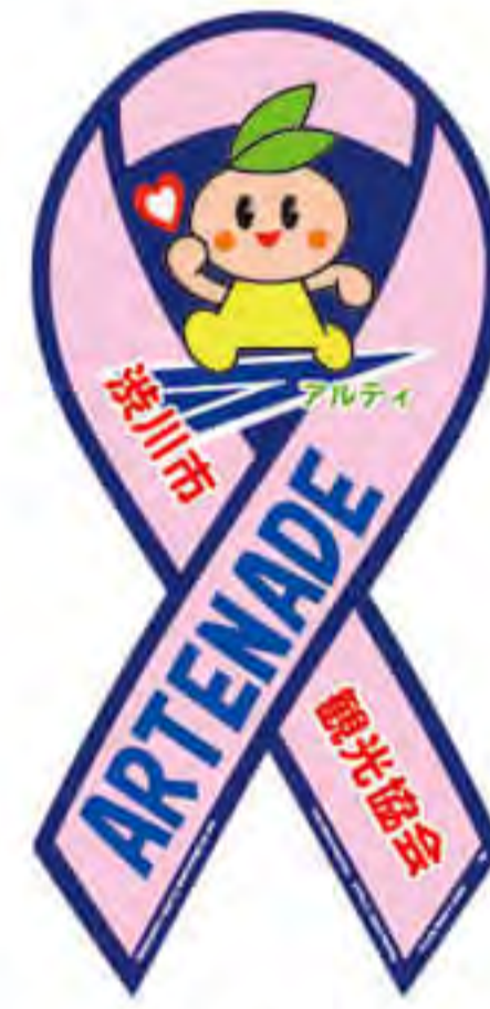
渋川市観光協会様