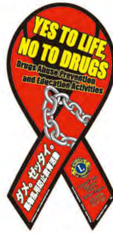
東京八王子陵東ライオンズクラブ様