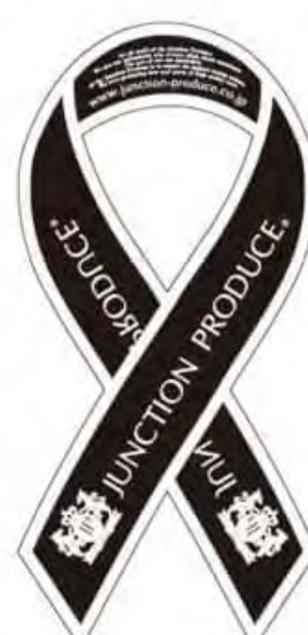
ジャンクション様