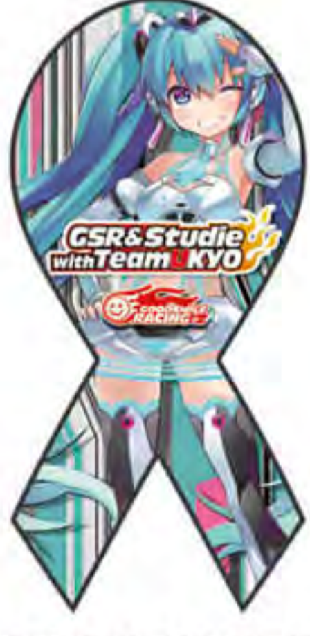
GOOD SMILE RACING 様