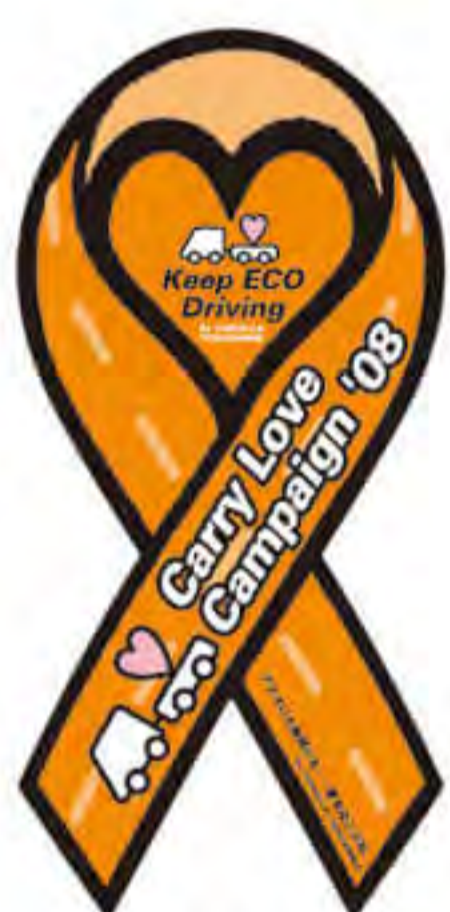
トヨタカローラ 徳島様