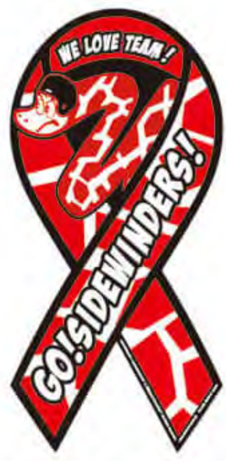
サイドワインダーズ様