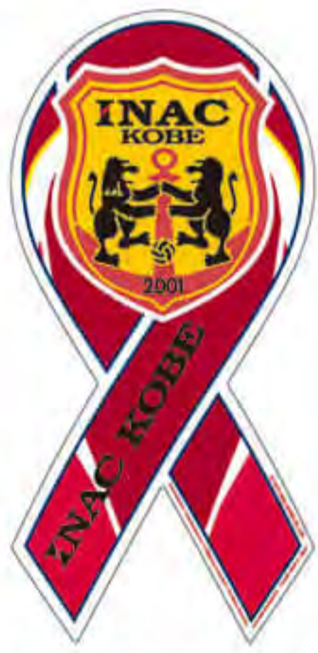
アイナック神戸様