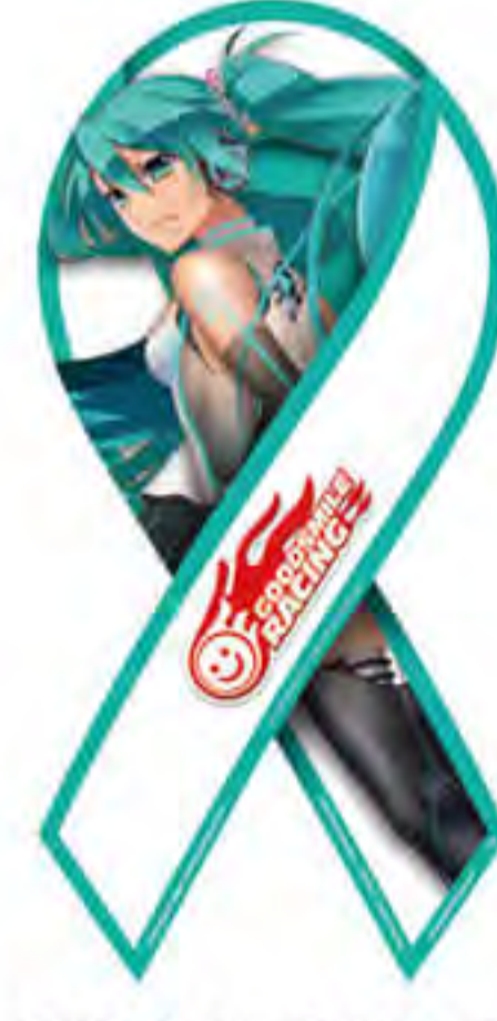
GOOD SMILE RACING 様