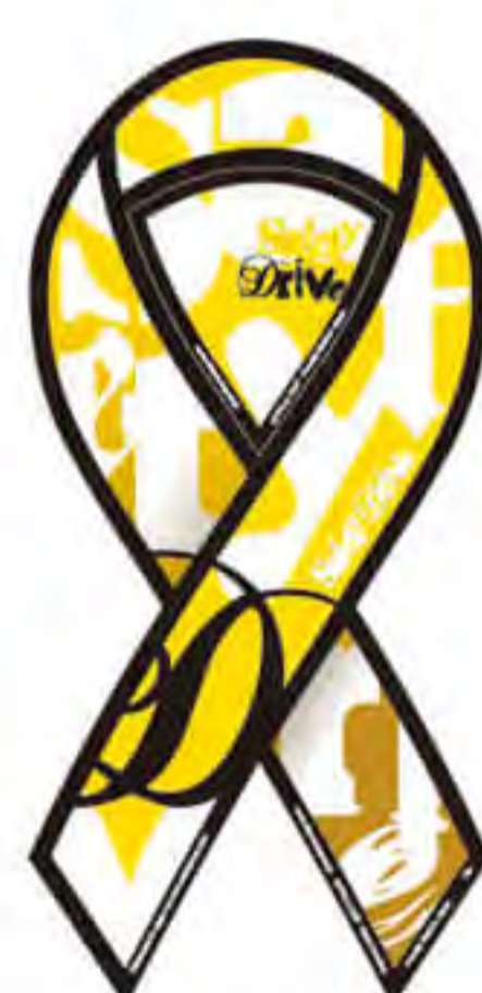
ホンダカーズ 三重東様