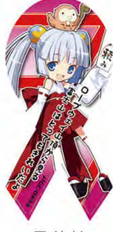
昇仙峡 ロープウェイ様