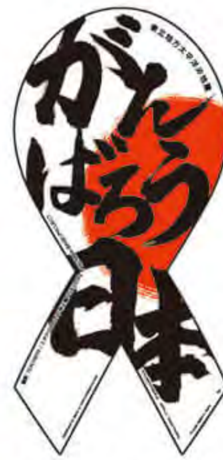
ティーチャーズ様