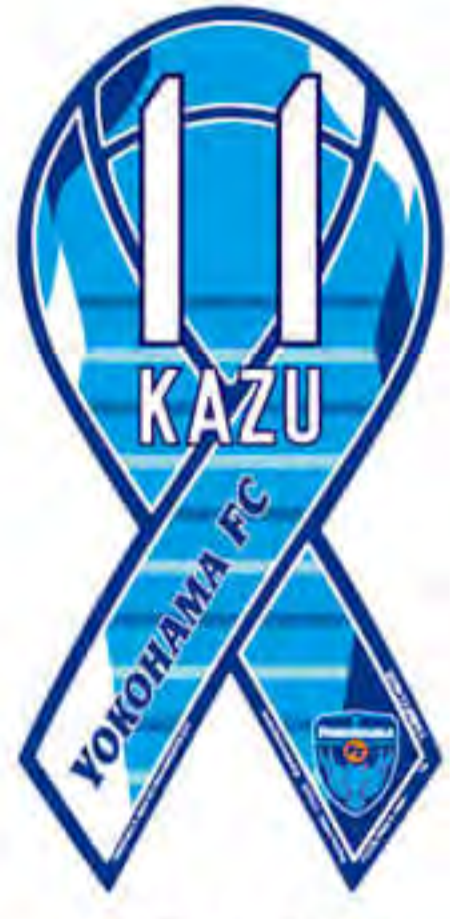
横浜 FC 様