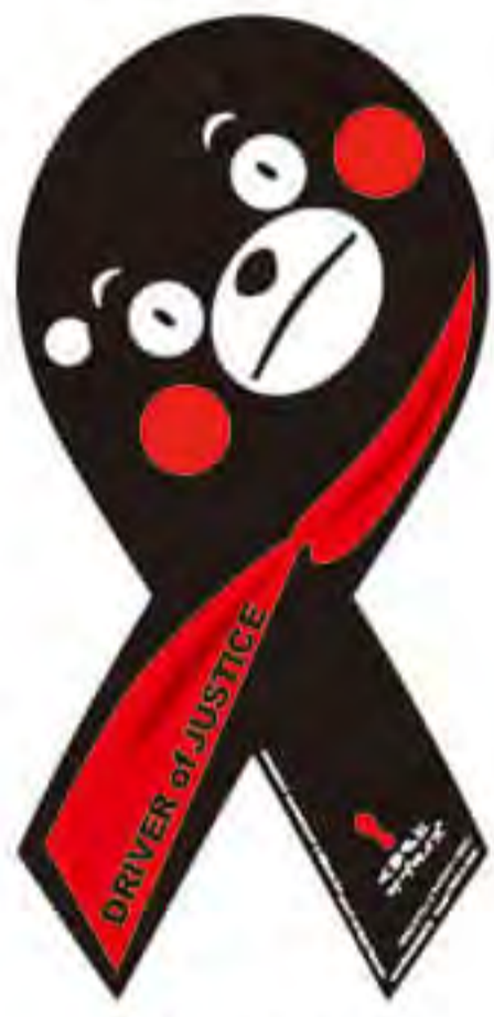
ブレイン トラスト様