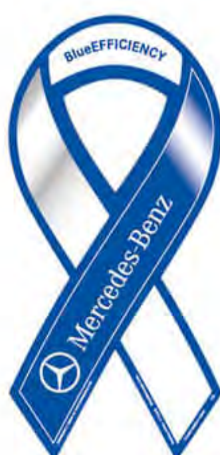
メルセデス・ベンツ様