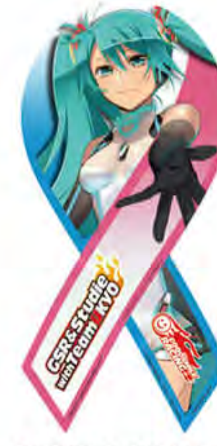
GOOD SMILE RACING 様