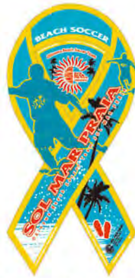
ソーマプライア様