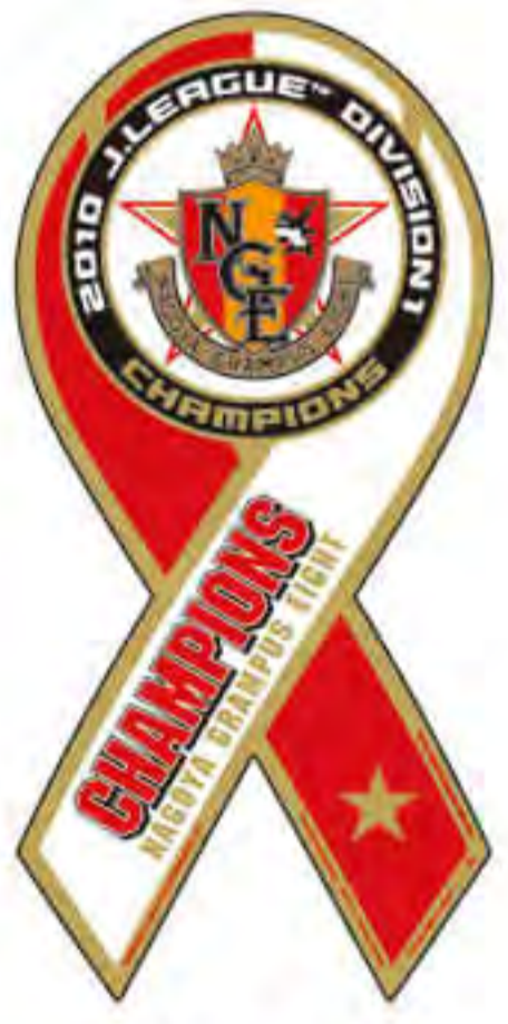
名古屋 グランパスエイト様