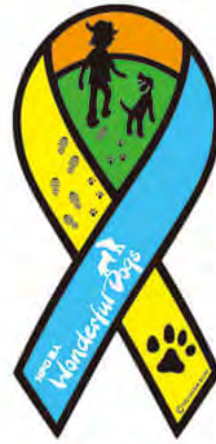
ワンダフルドッグ様