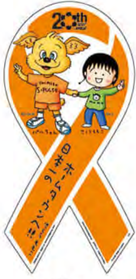
清水 エスパルス様