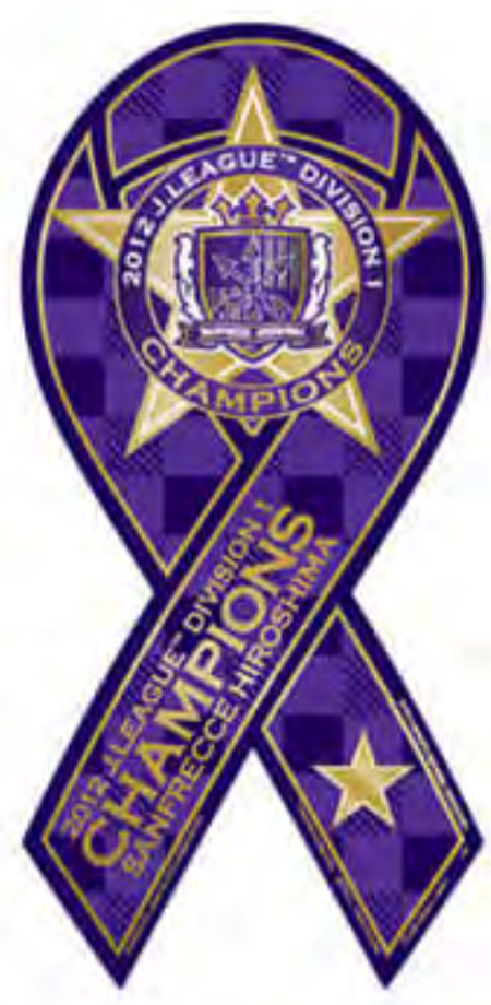
サンフレッチェ 広島様