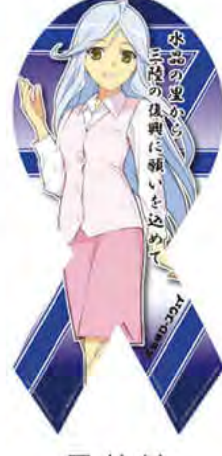
昇仙峡 ロープウェイ様