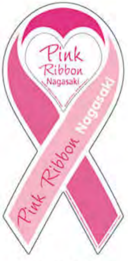
ピンクリボン長崎様