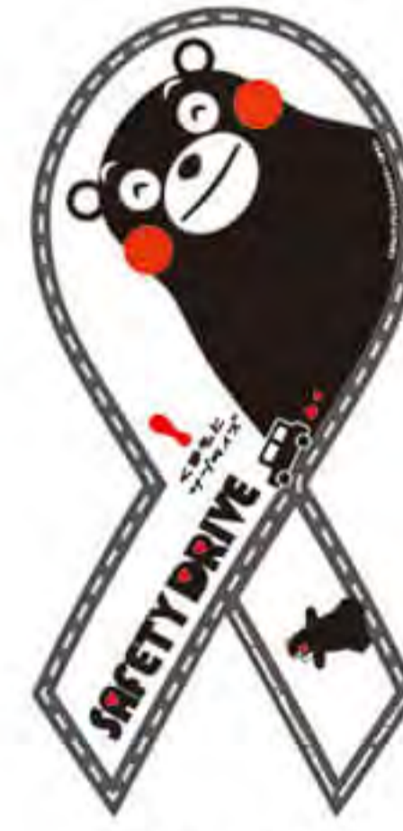
ブレイン トラスト様