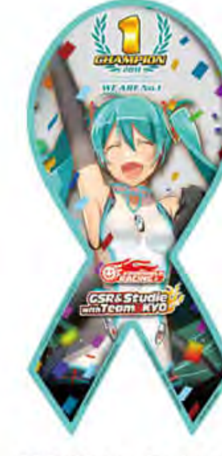
GOOD SMILE RACING 様