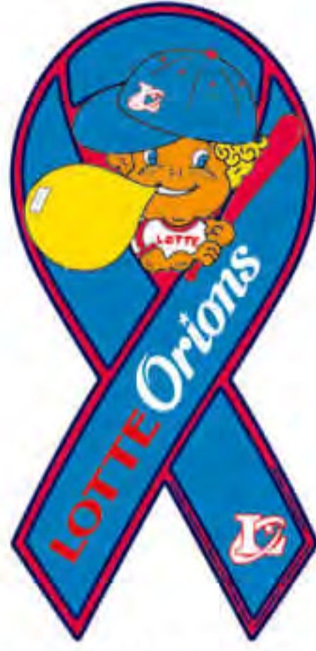
千葉ロッテ マリーンズ様