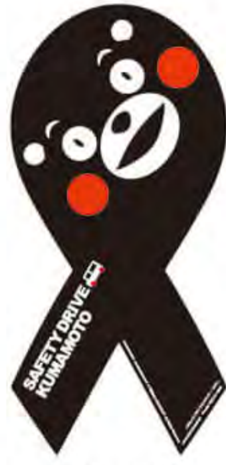
ブレイン トラスト様