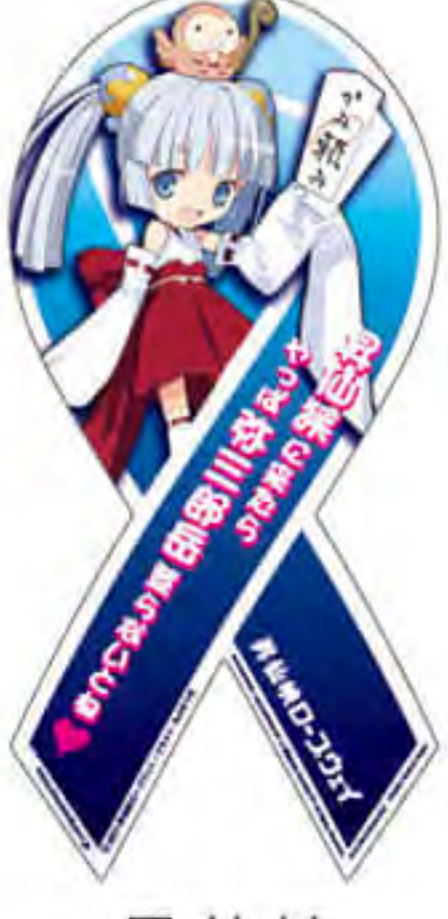
昇仙峡 ロープウェイ様