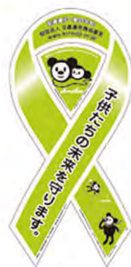
交通遺児等育成基金様