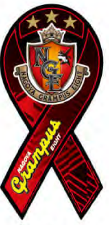
名古屋 グランパスエイト様