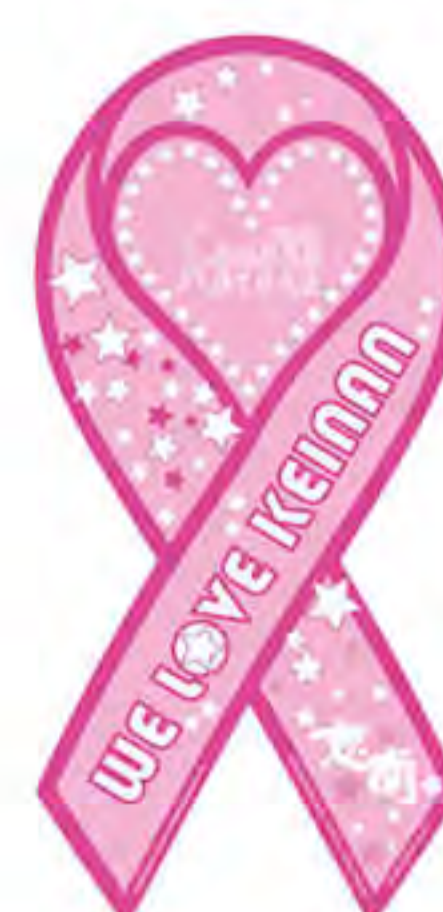
恵南商工会青年部様